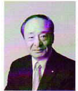
大信産業株式会社